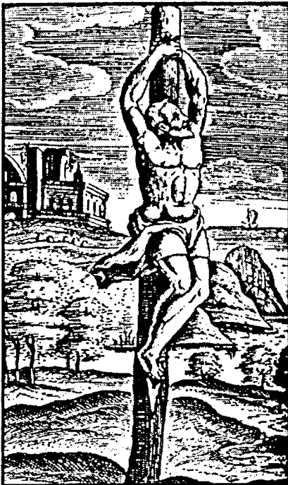
La Cruz simple, por Justo Lipsio

La cruz, como símbolo religioso, fue conocida en todas partes del mundo, lugares como China, India, Africa, América e incluso Australia. La cruz como forma de tortura fue empleada por primera vez por los persas. Más tarde fue usada por los griegos, cartagineses y romanos como método de castigo. De hecho, los romanos la usaron a gran escala en todos los pueblos bajo su dominio. Un claro ejemplo fue en Palestina. Entre los años 174 a 164 a.C.